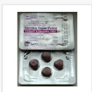
SNOVITRA SUPER POWER €20.50