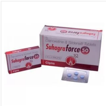
SUHAGRA FORCE 50 MG