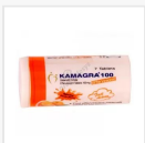
KAMAGRA EFFERVESCENT-100 MG €45.00