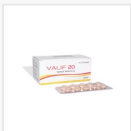
VALIF 20 MG €26.00